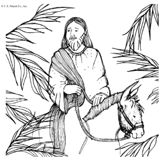
Blessed is he who comes in the name of the Lord.